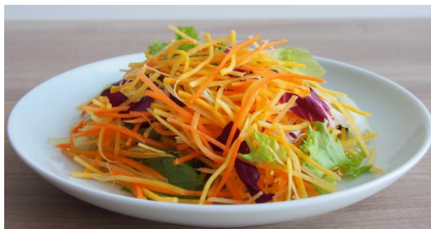
お家で作るごちそうサラダ 春のサラダ用

＜本件に関する問い合わせ先＞ 株式会社サラダクラブ 商品部 藤田・阿部 TEL. 03-5384-7690(直通) FAX. 03-5384-7805 〒182-0002 東京都調布市仙川町2-5-7 http://www.saladclub.jp E-mail. info@saladclub.jp