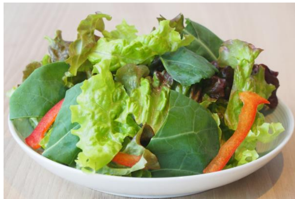
「ケールサラダ」 盛り付けイメージ

ケールは栄養価が高く、キャベツと比較すると、カルシウムはキャベツの約 5 倍、食物繊維は約 2 倍、ビタミン C は約 2 倍となっています。青汁に使われることが多い野菜です。※補足参照