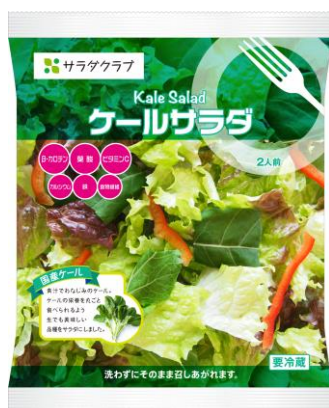
「ケールサラダ」 商品画像

「ケールサラダ」は、2015 年 2 月 25 日（水）からテスト的にエリア限定で新発売した商品です。発売後、全国のお客様より販売の要望をいただき、量販店からの取り扱い希望も多かったことから、全国発売に向けて取り組みを強化してきました。今回、国産の「ケール」を生産する契約産地を増やし、一定量の「ケール」を入手することが可能になったことから、「ケールサラダ」の販売エリアを沖縄県を除く全国に拡大します。