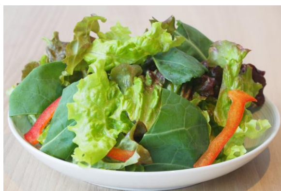
「ケールサラダ」 盛り付けイメージ

ケールは栄養価が高く、キャベツと比較すると、カルシウムはキャベツの約 5 倍、食物繊維は約 2 倍、ビタミン C は約 2 倍となっています。青汁に使われることが多い野菜です。※補足参照