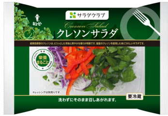
「クレソンサラダ」(85g/198円)