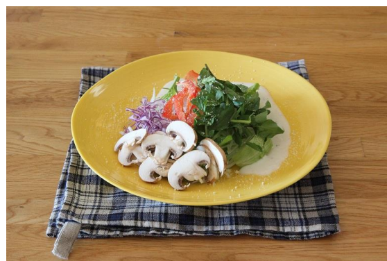
「クレソンとマッシュルームのシーザーサラダ」

※アレンジメニューは、サラダクラブ「野菜たっぷりレシピ」（ http://c.saladclub.jp/recipe/index.html ）にて、9 月 20 日（火）より掲載予定