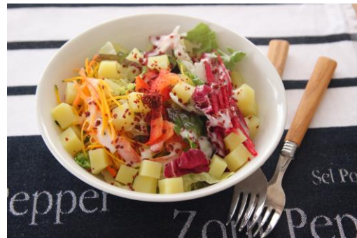
「ビーツとポテトのサラダ」

※アレンジメニューは、サラダクラブホームページ内「野菜たっぷりレシピ」にて4月22日（土）から掲載予定