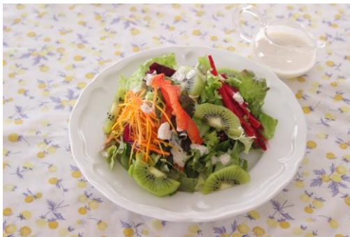
「アマランサスソース ビーツとフルーツのサラダ」