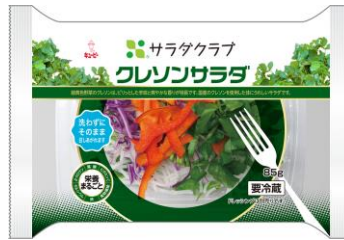
「クレソンサラダ」 (85g/198円)