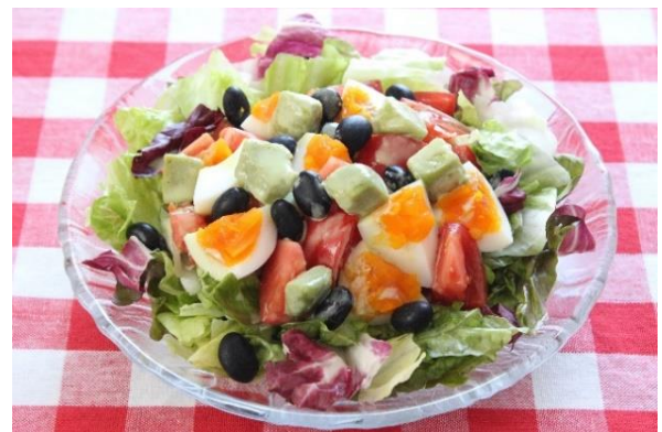
【アレンジメニュー】 「黒豆とクリーミーアボカドのサラダ」