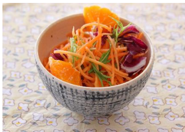
みかんのキャロットラペ