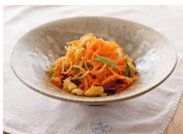
ほんのり甘いしりしり風サラダ